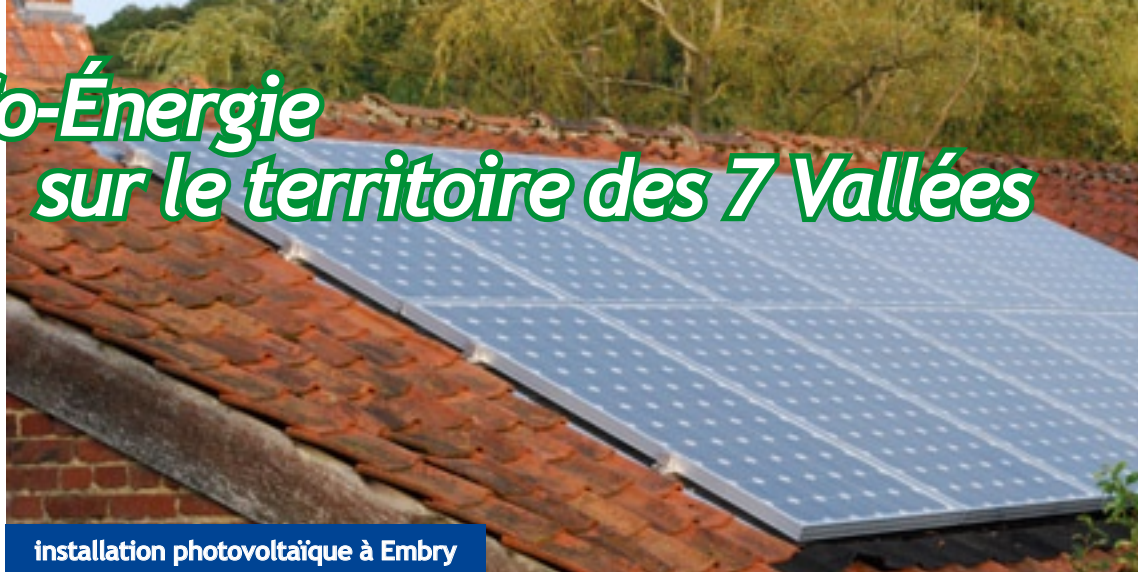
installation photovoltaïque à Embry

L'activité Conseil des Espaces Info Énergie de la Région Nord-Pas de Calais a été évaluée en 2008. Le cabinet Galliléo a été mandaté par la délégation régionale de l'ADEME -Agence de l'Environnement et de la Maîtrise de l'Énergie afin d'effectuer cette évaluation. Pour chaque EIE, un échantillon représentatif a été sélectionné : c'est ainsi que 128 personnes ayant contacté notre EIE entre 2005 et 2007 ont été interrogées. 83 % de ces personnes ont émis un avis de très satisfaisant à assez satisfaisant vis à vis des prestations fournies par notre EIE et 51 % se sont engagées dans des travaux lourds, à la suite de la prise de contacts.