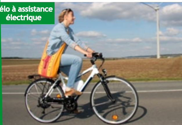
Vélo à assistance électrique

La problématique Transports et mobilité est une préoccupation de l'EIE. Nous tentons de répondre aux questions des particuliers, à faire connaître l'initiative de Lien Plus sur le covoiturage... Nous terminerons ce bilan en vous présentant l'action menées auprès des commerçants du canton de Fruges et le programme de sensibilisation à l'habitat écologique.